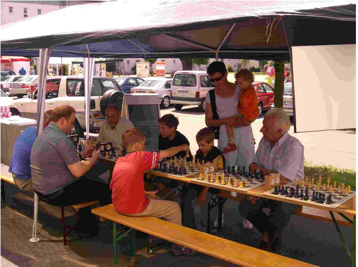
Bild 7 SC Sillenbuch beim Tag der Offenen Tür der IG Heumaden-Mitte

Dies ist eine Vorauswahl; die Bilder liegen in besserer Qualität bei Bedarf vor.