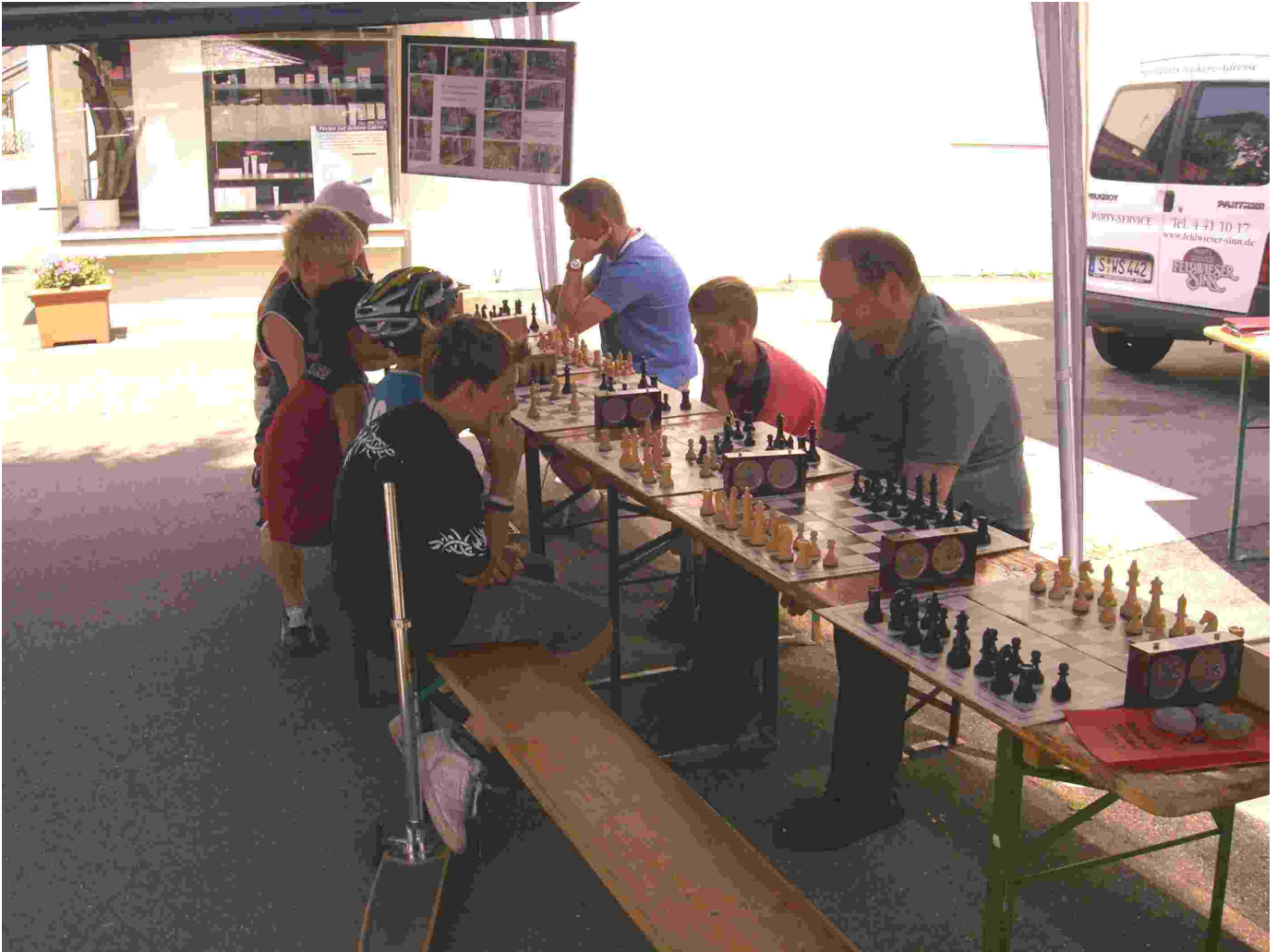
Bild 6 SC Sillenbuch beim Tag der Offenen Tür der IG Heumaden-Mitte