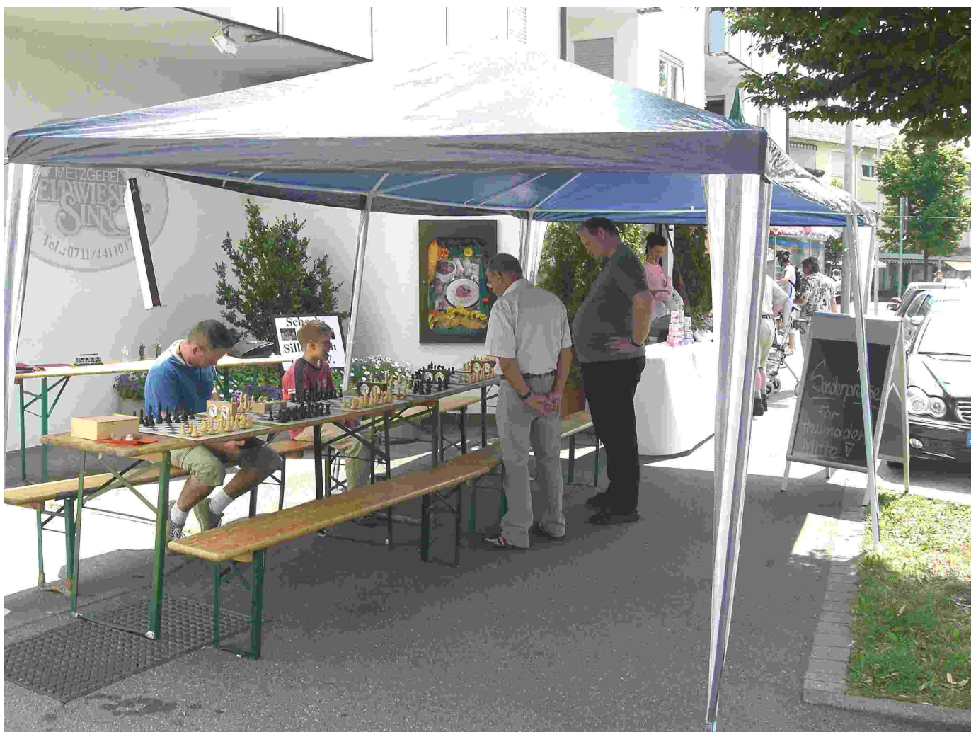
Bild 4 SC Sillenbuch beim Tag der Offenen Tür der IG Heumaden-Mitte

(Jäger) Am 15.7.06, dem "Tag der Offenen Tür" der IG Heumaden-Mitte, präsentierte sich der SC Sillenbuch mit einem eigenen Stand dem Publikum. Auf zwei Fotowänden zeigte der Schachclub Höhepunkte aus dem Vereinsleben z. B. eine Simultanveranstaltung mit dem Großmeister Igor Chenkin, der am 1. Brett des Bundesligisten Tegernsee spielt. Es gab die Möglichkeit mit Spielern des SC Sillenbuch eine Partie zu spielen, sich von ihnen Tipps geben zu lassen und es wurden Handzettel mit Informationen über den Verein verteilt. Das Interesse an unserem Schachstand war am Anfang etwas dürrig, wurde aber zum Nachmittag hin erfreulich groß. An dieser Stelle wollen wir uns nochmals bei der Metzgerei Feldwieser-Sinn bedanken, die bereitwillig den Stand zur Verfügung gestellt hat.