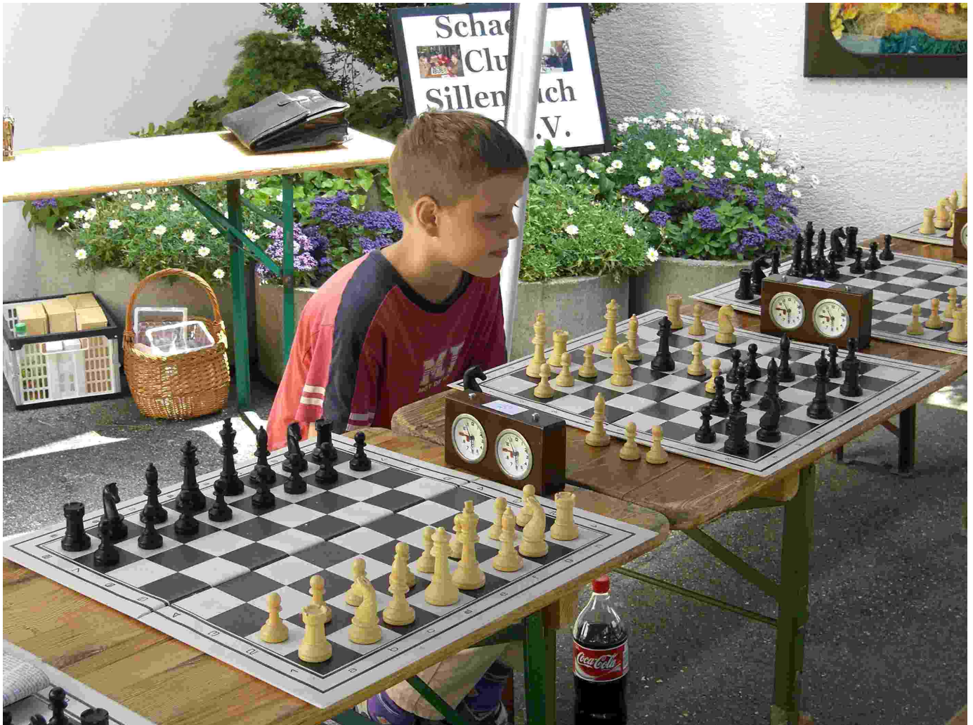
Bild 5 SC Sillenbuch beim Tag der Offenen Tür der IG Heumaden-Mitte

Zur Information jener Interessierten, jung oder alt, die nicht unseren Stand besuchen konnten, seien noch einmal die Trainingszeiten genannt: Erwachsene freitags ab 18.30 Uhr , Jugendliche mittwochs ab 16.30 Uhr oder freitags ab 18 Uhr. Ort des Geschehens: Clara-Zetkin-Haus in der Gorch Fock-Straße gegenüber dem Jugendhaus.