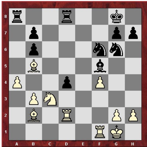
Diagramm 2: Schwarz hat gerade 22...d4 gezogen in Erwartung der Variante 23. Se2, d3 24. Sg3, Se4 25. Sxe4, Lxe4 Was hat er übersehen?